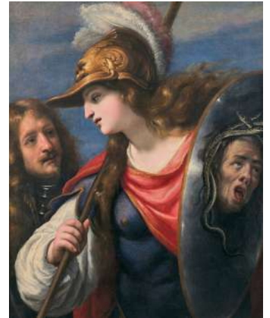
Cosimo Ulivelli, Portrait de Don Lorenzo de Medici sous la protection d'Athéna, déesse des Arts et de la Guerre , huile sur toile, collection particulière