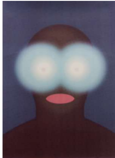
Guillaume Pinard, Sidération , 2016, sérigraphie sur papier Rivoli, 30 exemplaires, Macumba night club éditions, Lyon, Artothèque, photo David Ancelin, courtesy galerie Anne Barrault, Paris, Adagp, 2023