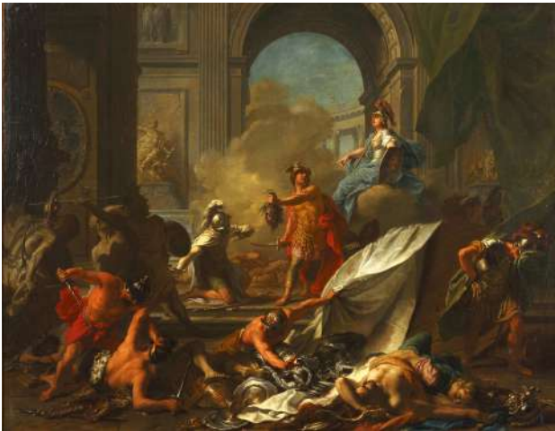
Jean-Marc Nattier, Persée assisté par Minerve, pétrifie Phinée et ses compagnons en leur présentant la tête de Méduse , 1718, Tours, musée des Beaux-Arts