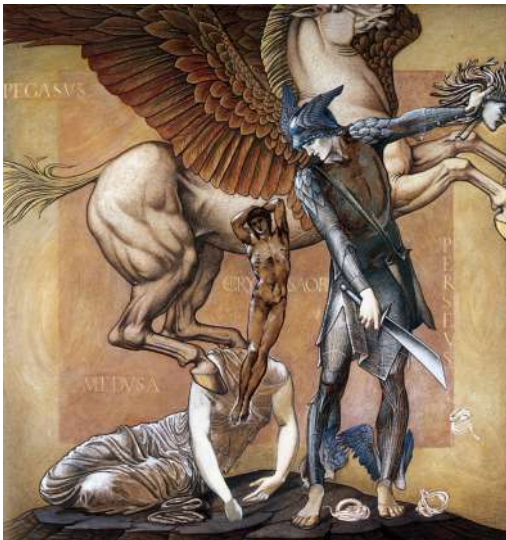
Edward Burne-Jones, La Mort de Méduse (Série Persée ), vers 1882, gouache, Southampton, City Art Gallery