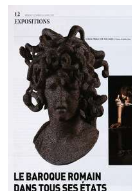
Christelle Mally Masque de Méduse , d'après Bernin, 2020,