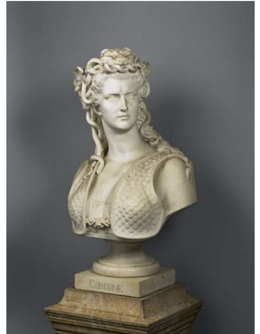
Adèle d'Affry, dite Marcello, Gorgone , 1864-1865, marbre avec rehauts d'or, h. 90 ; l. 65 ; p. 30 cm., Centre national des arts plastiques, en dépôt au Musée national du château de Fontainebleau