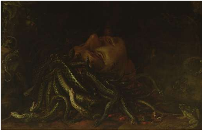
Anonyme (Flamand ?, jadis attribué à Léonard de Vinci) Méduse , vers 1600 Florence, Musée des Offices

À la Renaissance, les artistes s'efforcent de représenter Méduse de manière la plus mimétique possible : le monstre doit être naturel et convaincant. C'est à cette époque que certaines des représentations les plus surprenantes et les plus originales de Méduse ont vu le jour. Le mythe dans son ensemble connaît une véritable renaissance, avec des modèles devenus récurrents, tels le Persée et Méduse de Cellini ou la Tête de Méduse alors attribuée à Léonard de Vinci. S'appuyant sur le récit des Métamorphoses d'Ovide, les artistes européens représentent à partir de la Renaissance et pendant les deux siècles qui suivent l'ensemble des épisodes du mythe : la décapitation de Méduse, Persée délivrant Andromède, la pétrification de Phinée.