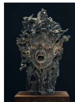
Ivan Theimer, Méduse , 2008