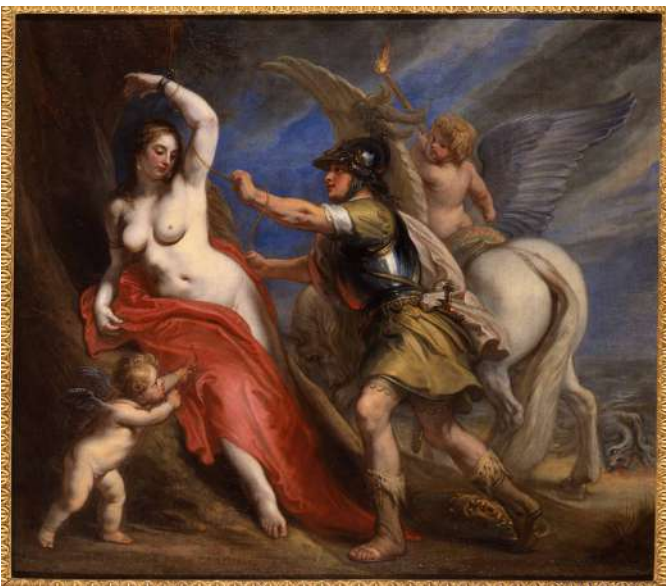
Theodoor Van Thulden, Persée délivrant Andromède , 1646, huile sur toile, 110 x 116 cm, Nancy, Musée des Beaux-Arts