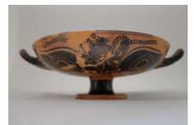
Coupe à yeux attique à figures noires, vers 510 av. J.-C., céramique, Boulogne-sur-Mer, Château-Musée