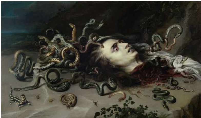
Rubens et Snyders, Méduse décapitée , 1617-18, huile sur toile, Vienne, Kunsthistorisches Museum, Gemäldegalerie

Figure incontournable de la mythologie grecque, Méduse a exercé son pouvoir de fascination sur de nombreuses générations d'artistes qui ont contribué à la création d'un répertoire d'images d'une richesse inouïe. Communément reconnaissable à sa chevelure grouillante de serpents et ses yeux écarquillés, la figure de Méduse n'a cessé de se renouveler à travers les âges. L'exposition du musée des Beaux-Arts de Caen est consacrée à l'évolution de ces représentations, des premières sources iconographiques de l'Antiquité jusqu'aux productions artistiques les plus récentes.