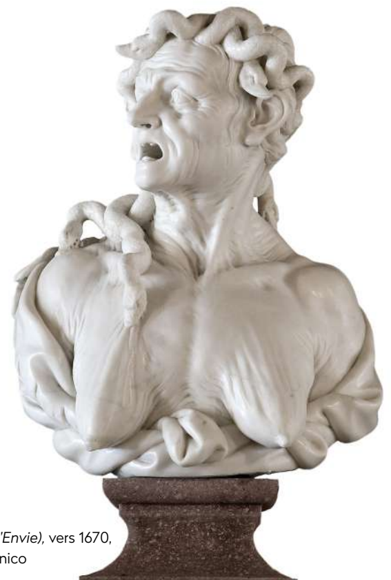
Enrico Merengo, Invidia (L'Envie) , vers 1670, marbre, Venise, Ca' Rezzonico

Méduse partage sa chevelure reptilienne avec quelques divinités, ainsi qu'avec deux personnages allégoriques. Les Érinyes proviennent comme Méduse des plus anciens mythes grecs. Figures vengeresses, elles sont au nombre de trois : Alecto (Implacable), Tisiphoné (Vengeance) et Mégère (Haine). Elles traquent sans relâche les meurtriers pour les punir. D'autres personnages incarnent un type de danger (les grandes épidémies, comme la peste) ou un vice, tel que l'Envie (Invidia), personnifié par Ovide dans ses Métamorphoses sous les traits d'une créature livide et décharnée, dévorant « des chairs de vipères, aliment de ses vices.